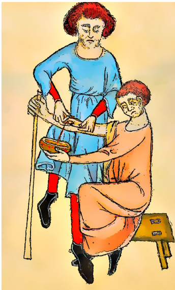
Luttrell Psalter. England 1340. London Britisches Museum Add. Ms. 42130

Bei der Betrachtung von sogenannten Aderlass- und Brennstellentafeln aus Mittelalter und Renaissance fällt auf, dass diese Stellen über den ganzen Körper verteilt sind. Sie beschränken sich also nicht auf die Blutgefäße der Arme. Diese Lass- und Brennstellen sind interessanterweise deckungsgleich mit Akupunkturstellen der TCM. Vergleicht man die Indikationen der Stellen, die in den Lass- und Brennstellentafeln angegeben sind, mit den Indikationen deckungsgleicher Akupunkturpunkte, bekommt man identische Indikationen und Wirkungen genannt.